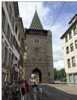
Das Spalentor in Basel.

Spalentor namentlich mit einem Waffeninventar. Der Bau wurde vermutlich im Jahr 1398