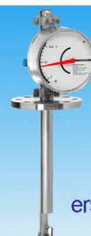
ZM-VL ersetzt Helios A2