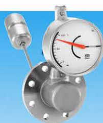
ZM-HL ersetzt Helios A2H