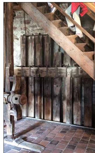
Das noch funktionsfähige Fallgitter im Spalentor.

An dieser Stelle danke ich im Namen des SCV Nordwestschweiz allen Teilnehmerinnen und Teilnehmern für ihre Beteiligung an der Führung und ich freue mich, Sie bei einem anderen Anlass wieder begrüßen zu dürfen.